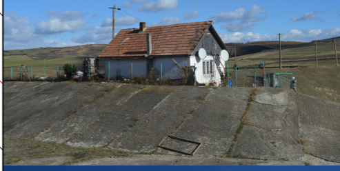
Construcție existentă propusă spre demolare