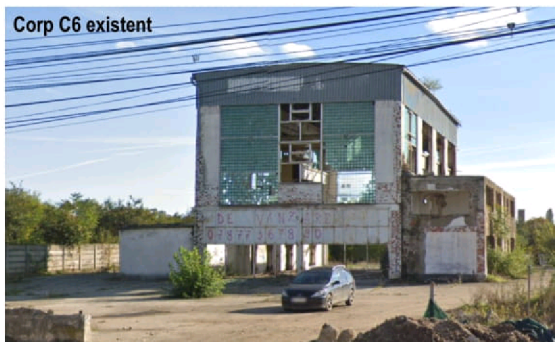
Corp C6 existent